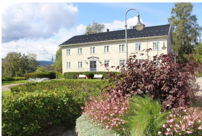
Det gamle internatet