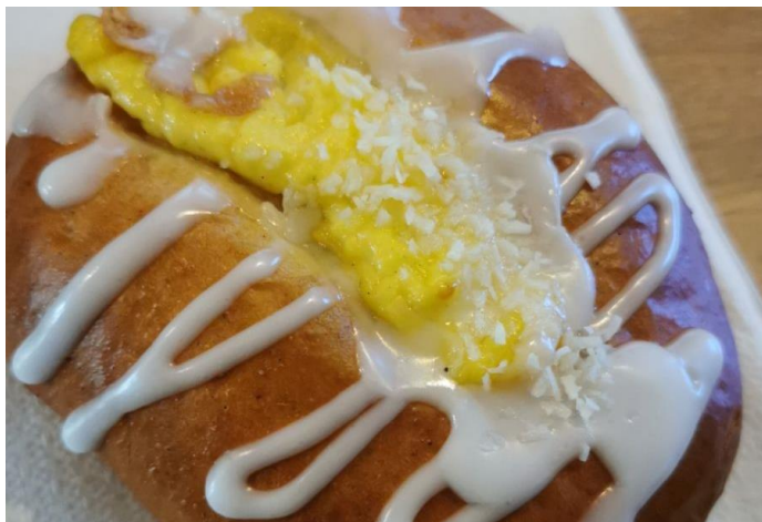
Deilig bakst i kantina.