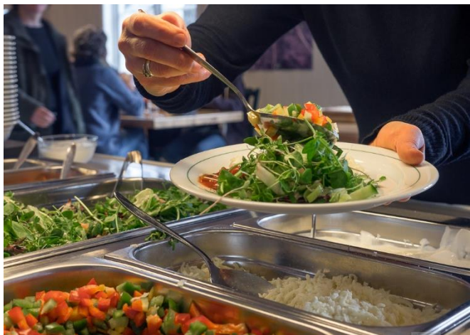
Lunsj i kantina.

Det er kun mulig å betale med betalingskort eller vipps i kantina (ikke kredittkort). Det er ikke kontantsalg, da alle transaksjoner går via kortterminal. Kaffe betales med kort, mens produkter fra matskapet betales med Vipps.