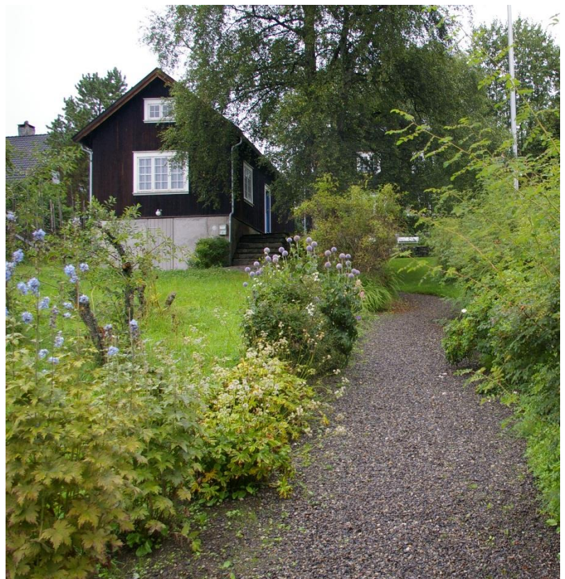
Bilder fra to historiske anlegg, Hovelsrud og Bjerkebekk.