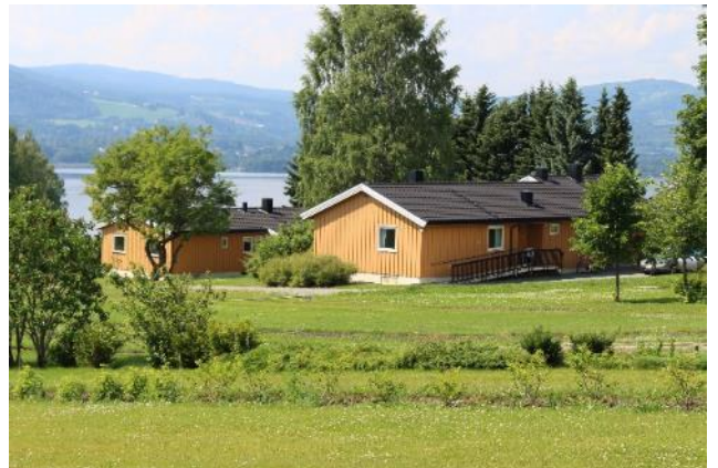
Øvre- og nedre lærerbolig ligger på andre siden av veien, nord for plantefeltene.