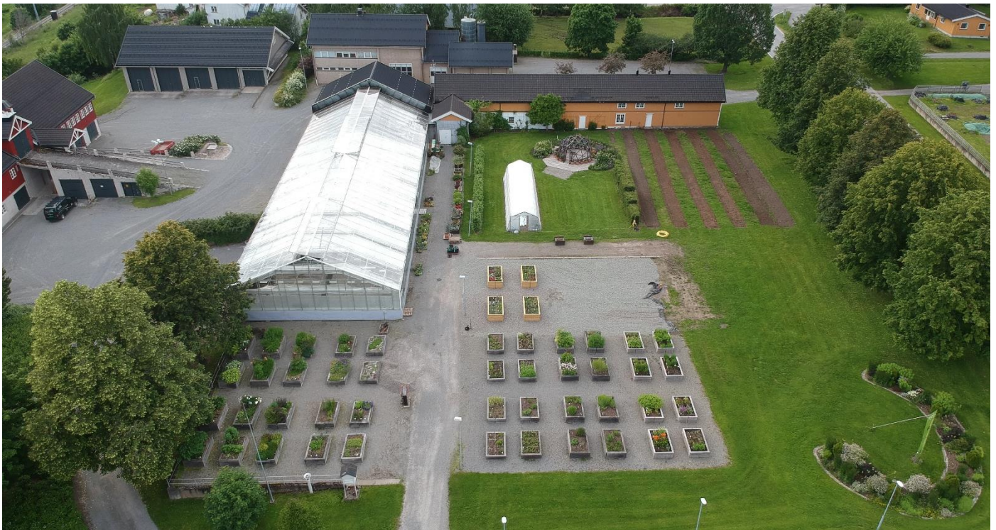
Pensumplanter er samlet i kasser ved veksthuset.