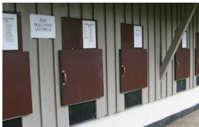
Kildesortering ved Redskapshuset