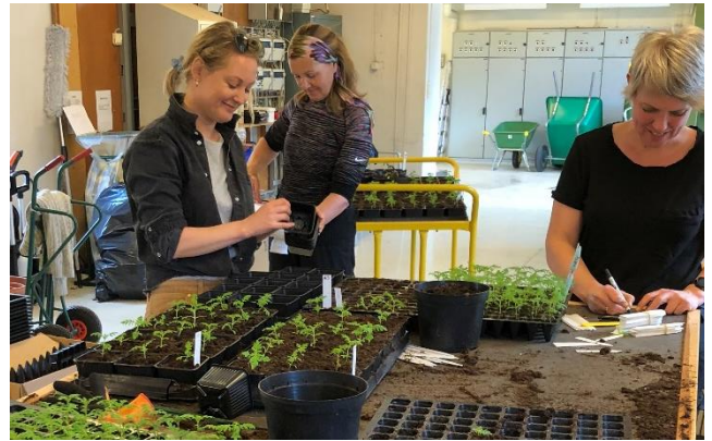
Arbeidsrommet i veksthuset benyttes i gartnerundervisningen.