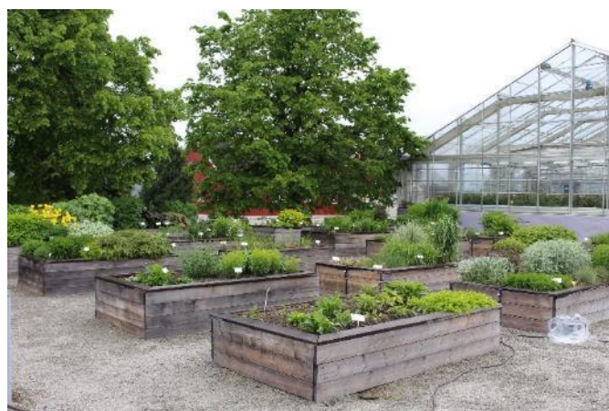
Utenfor veksthuset er staudene plantet i kasser.