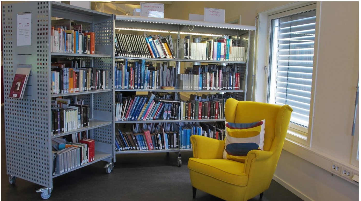
Bilde fra biblioteket.

Vi kommer tilbake med ny informasjon om biblioteket, så snart det er klart.