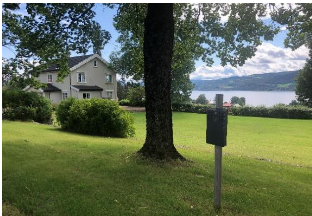
Røyking er tillatt to steder på Veia.

Røyking er kun tillatt to steder på Veia: Bortenfor «Kjøkkenbygningen» på veien mot «Rektorboligen» og ved «Redskapshuset». Begge stedene er det satt opp askebeger som skal benyttes. Snus kaster du også her, aldri på bakken. Vis hensyn til andre studenter og ansatte på Veia. Regler for røyking gjelder for studenter, elever, ansatte og besøkende hele døgnet.