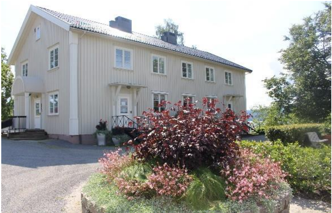
I kjøkkenbygningen finner du kantina.

Dette er en skolekantine med subsidierte priser. Kjøkkensjefen benytter råvarer som er produsert på Vea og har som mål å benytte mest mulig kortreiste og økologiske produkter.