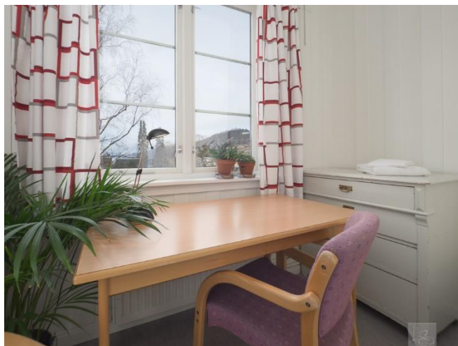
Bilde fra hybel i «Det gamle internatet».