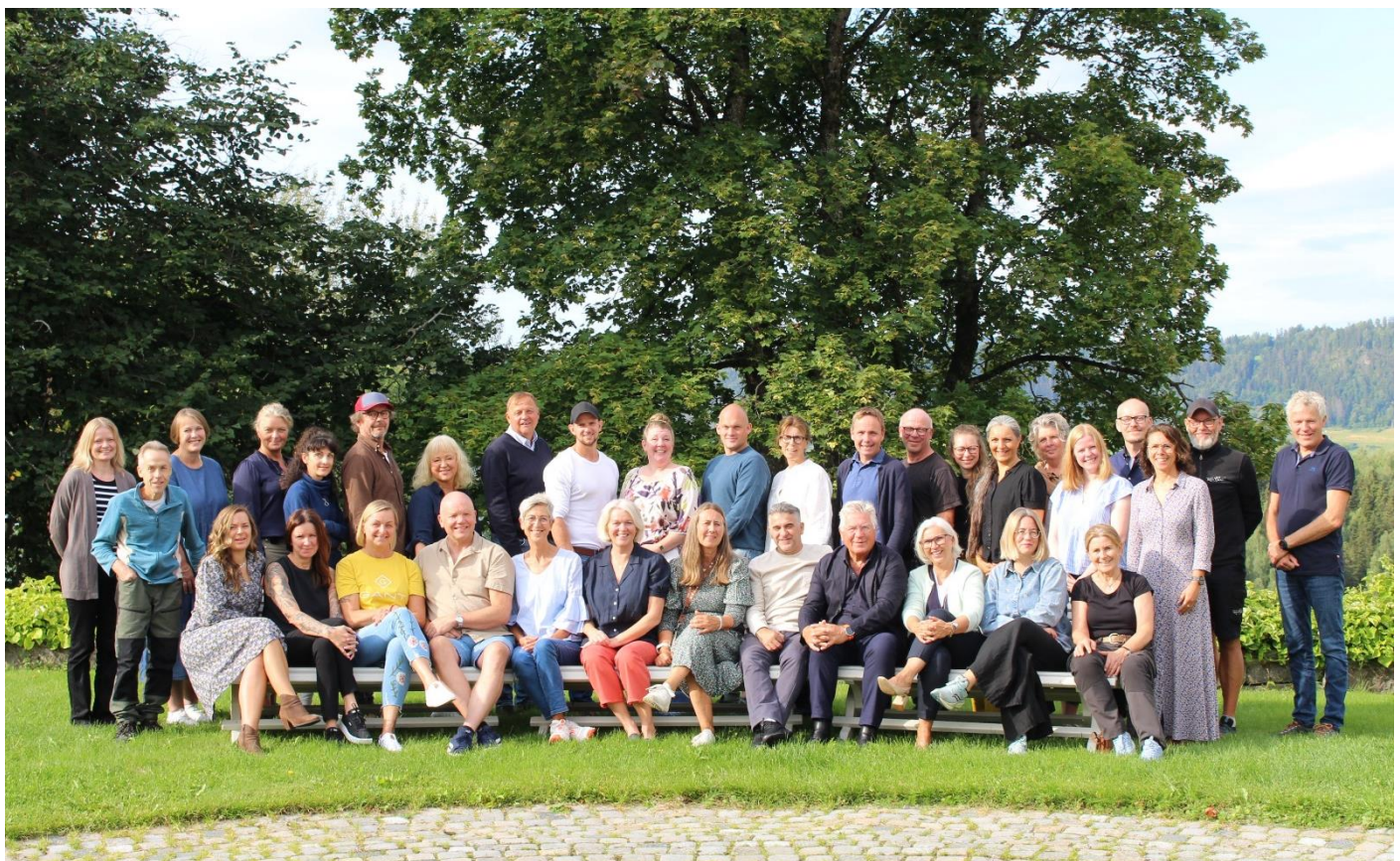
Alle ansatte på Vea er samlet, august 2024.