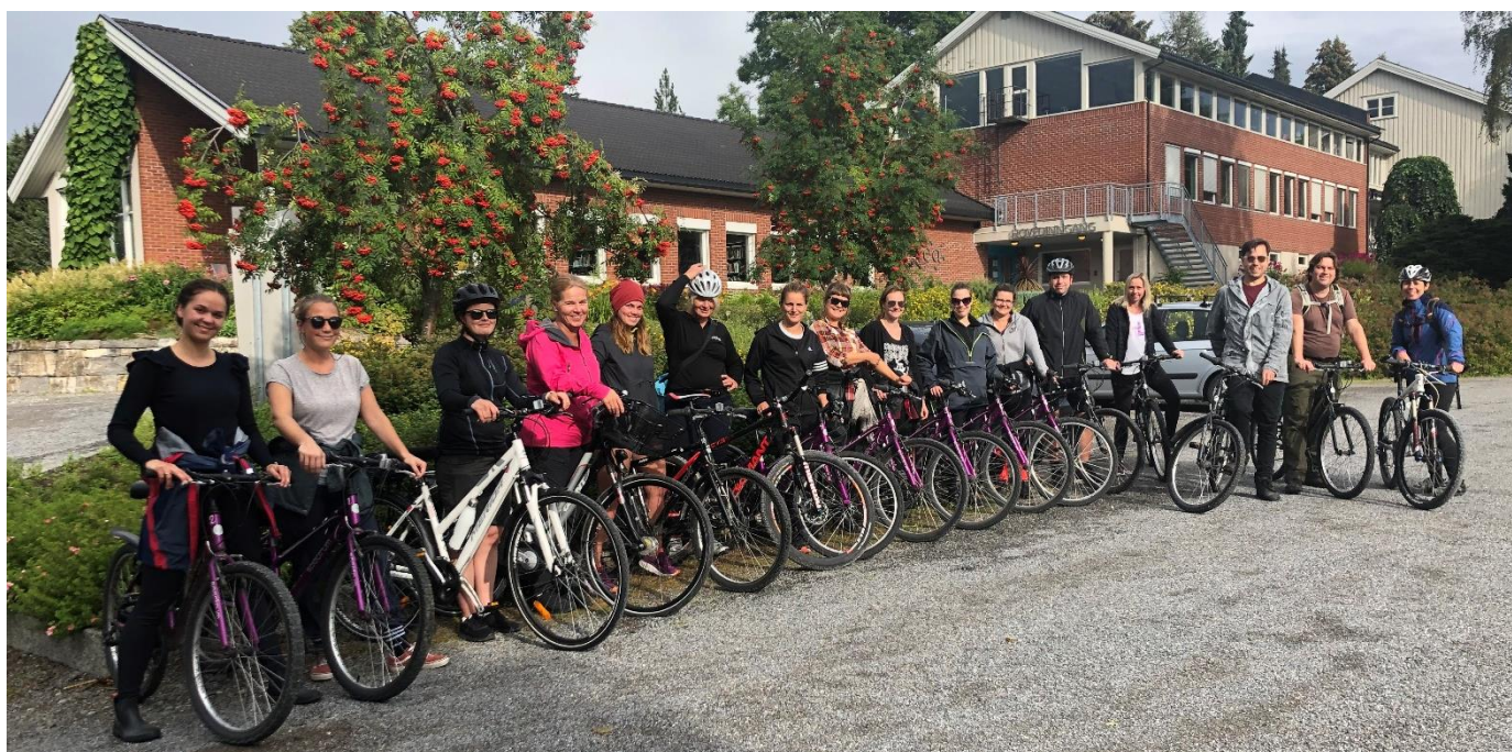
Med Veas sine utlånsykler, kan du sykle til Moelv for å handle, eller ta med klassen på tur.

I kjelleren på «Det gamle internatet» står det sykler til disposisjon for dere som er studenter og elever på Vea. Sykkelhjelmer må hver enkelt ta ansvar for selv. Husk å sette sykkel på plass igjen etter bruk, slik at flere får glede av den.